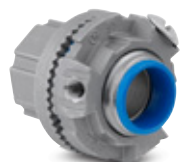
H050GRSST Conector de acero inoxidable aterrizado